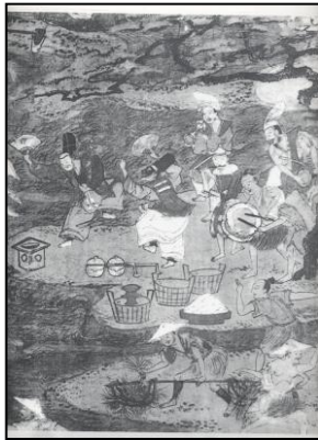
月次屏風田楽舞図（東京国立博物館蔵）

10世紀から11世紀にかけて、「猿楽」という、民衆の間で面白く余興的な芸能が芽生えるわけです。猿楽は能楽にどんどん発展していき、一部階級層のものに発達していくわけです。それが、一部では、田楽と言って、田んぼの神事として発達するわけです。当時は田楽浮立と言いました。昔は田んぼの楽、風立つと書くらしいですね。それが今では浮き立つとなっておりますね。